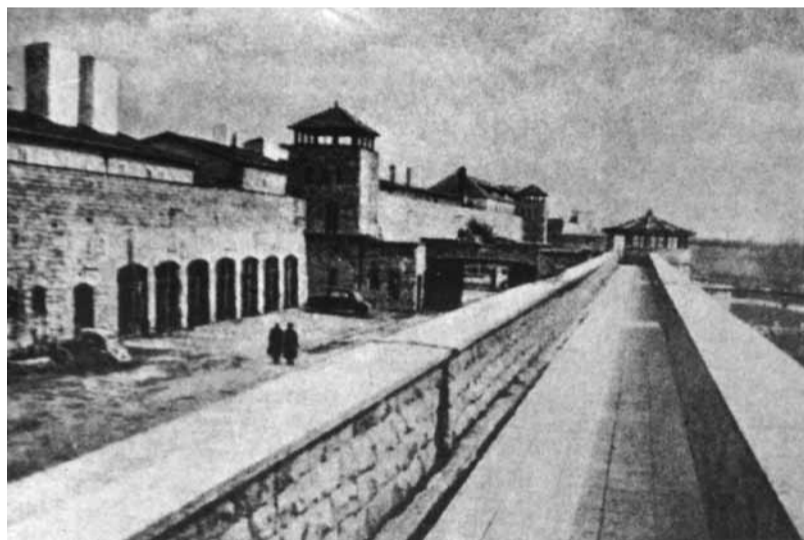
Aspecte del camp de Mauthausen, amb el mur perimetral a la dreta i les xemeneies dels forns on s'incineraven els cadàvers a l'esquerra. (Procedència: Roig, 2001).

Mauthausen finalitzarien a les acaballes de 1941. A partir de 1942, encara ingressarien en altres camps escampats pel Reich petits grups d'espanyols capturats per la Gestapo en accions de sabotatge o resistència antifeixista als territoris ocupats.