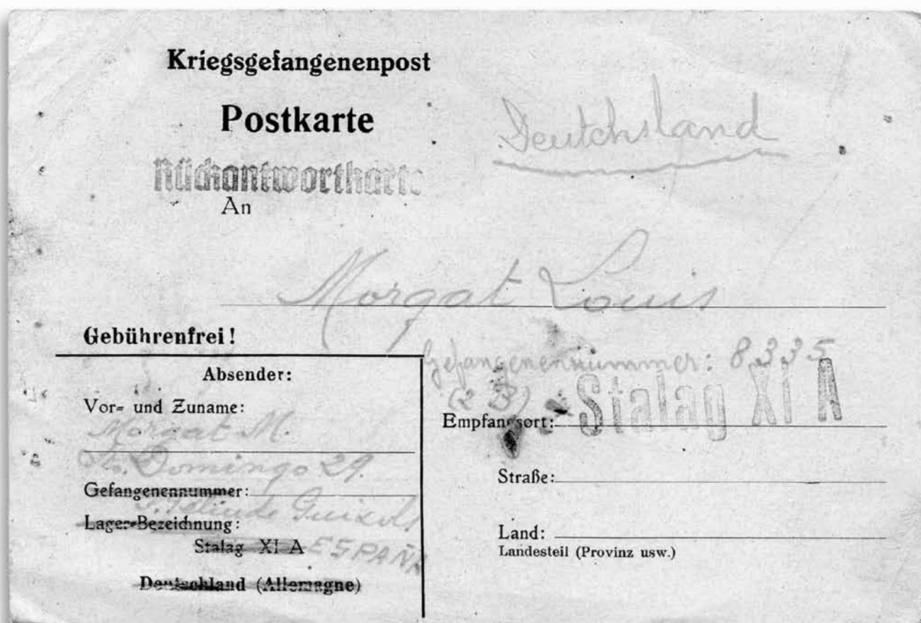
Anvers de la postal enviada per Lluís Morgat al seu pare des de l' Stalag XI-A , a Altengrabow, el 18 de febrer de 1941.